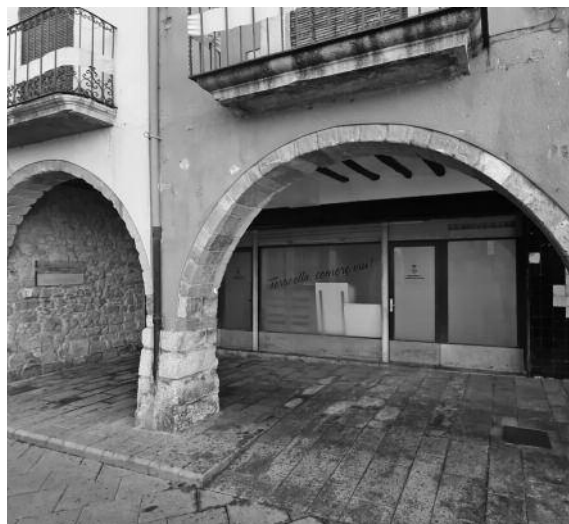
L'edifici de Can Castells es rehabilitarà per poder-hi ubicar l'Oficina de Turisme, una àrea d'exposició de productes de proximitat i l'Àrea de Promoció Econòmica.

El pla preveu una inversió de 655.000 euros per promoure la mobilitat sostenible: millorar i potenciar l'ús dels carrils bici, millorar la xarxa d'itineraris de descoberta del Parc Natural, i instal·lar nous punts de recàrrega per a vehicles elèctrics.