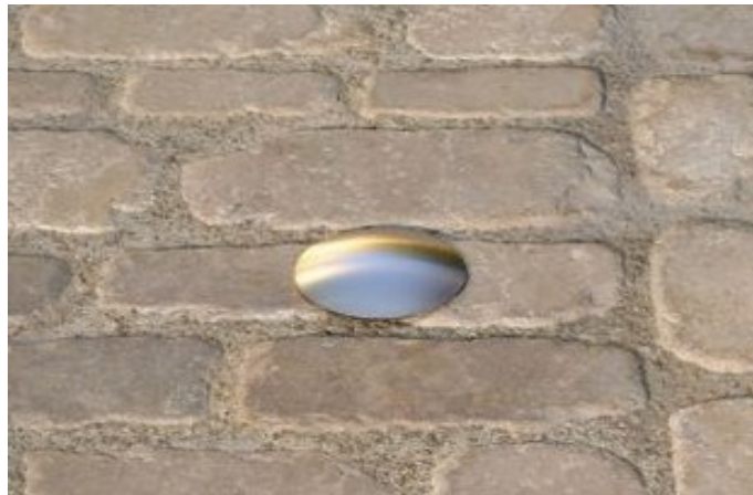
Marcador tipus botó per a delimitació d'OVP

Un cop concedida la llicència d'ocupació de via pública, serà necessari disposar de marcadors tipus botó podotàctic d'acer inoxidable al paviment, delimitant l'espai d'ocupació de via pública concedit. Serà responsabilitat del sol·licitant de la llicència d'ocupació de via pública la seva instal·lació coincident amb els límits concedits, així com la seva eventual modificació o remoció, deixant el paviment amb les mateixes condicions de conservació de la via pública que abans de ser instal·lades.