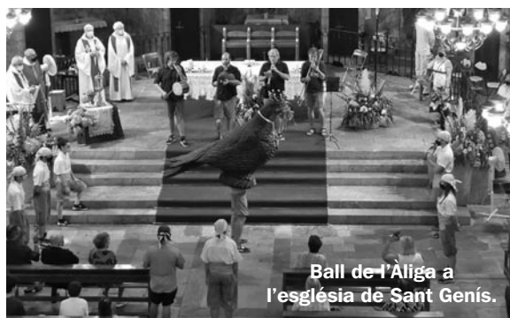
Ball de l'Àliga a l'església de Sant Genís.