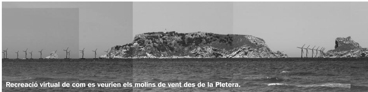
Recreació virtual de com es veurien els molins de vent des de la Pletera.