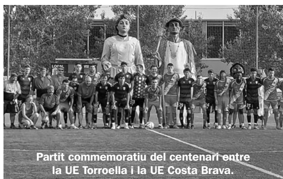
Partit commemoratiu del centenari entre la UE Torroella i la UE Costa Brava.