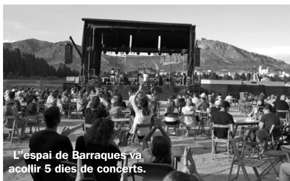
L'espai de Barraques va acollir 5 dies de concerts.

poder oferir a la ciutadania els actes festius típics de la festa, adaptats a les noves circumstàncies, esperant que en poguéssim gaudir tant els més petits, els joves com els més grans. Amb la col·laboració de les entitats de cultura popular hem pogut gaudir de l'imaginari més arrelat, i amb la implicació i organització de les entitats de Barraques hem creat un espai de trobada festiu per sopar i hem pogut gaudir de cinc nits de concerts. A totes les entitats vull donar les gràcies i encoratjar a seguir treballant tots junts per la nostra Festa Major.»