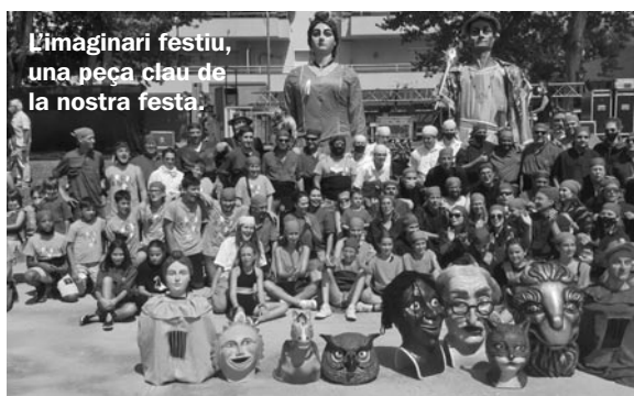
L'imaginari festiu, una peça clau de la nostra festa.