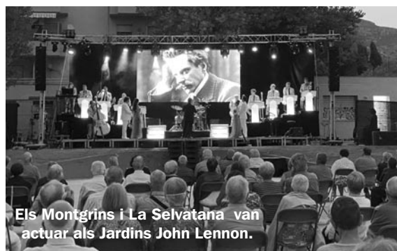
Els Montgrins i La Selvatana van actuar als Jardins John Lennon.