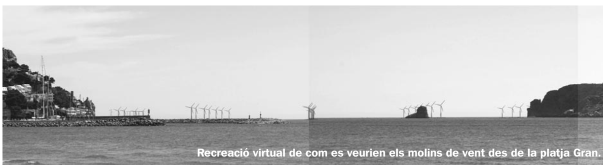
Recreació virtual de com es veurien els molins de vent des de la platja Gran.

El Ple va aprovar el mes de maig, per unanimitat, una moció en què manifesta la seva plena oposició al projecte de macro parc eòlic marí projectat a la Costa Brava, entre el cap de Creus i el cap de Begur. El consistori assegura que «ens trobem davant d'una agressió natural i econòmica sense precedents i de conseqüències irreversibles per a tot l'Empordà». També expressa el seu compromís a donar suport a les accions de la plataforma opositora que s'ha creat per frenar aquesta instal·lació.