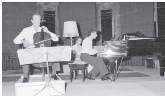
Concert Radu Aldulescu, violoncel; Antoni Besses, piano. © JOSEP LLORET · Festival de Torroella 1987