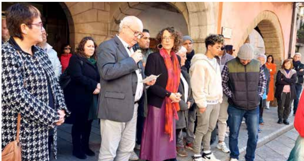
L'alcalde i la consellera d'Igualtat i Feminismes, al centre, durant la concentració de rebuig del 31 de gener.

Per canalitzar el dolor col·lectiu, manifestar el rebuig a l'atroc crim i donar suport a familiars i amistats, el dilluns (19 h) i el dimecres (12 h) l'Ajuntament va organitzar dues multitudinàries concentracions a la plaça de la Vila. Així mateix, es van decretar dos dies de dol, durant els quals la bandera de l'Ajuntament va onejar a mig pal.