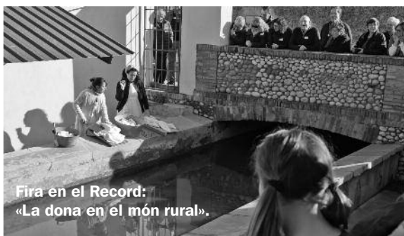
Fira en el Record: «La dona en el món rural».