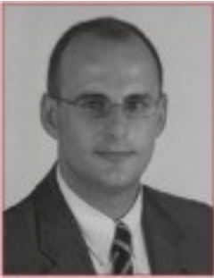
Carles Negre Alcalde

No m'equivocaré si afirmo que un dels fets més distintius i singulars del nostre municipi és el seu territori. A Torroella i l'Estartit ens sentim privilegiats de poder gaudir i ser dipositaris d'uns espais naturals tan rics com diversos. El Montgrí, les illes Medes, la Plana, el riu Ter, els aiguamolls, la platja, la costa configuren un llegat que hem de saber preservar amb especial sensibilitat.