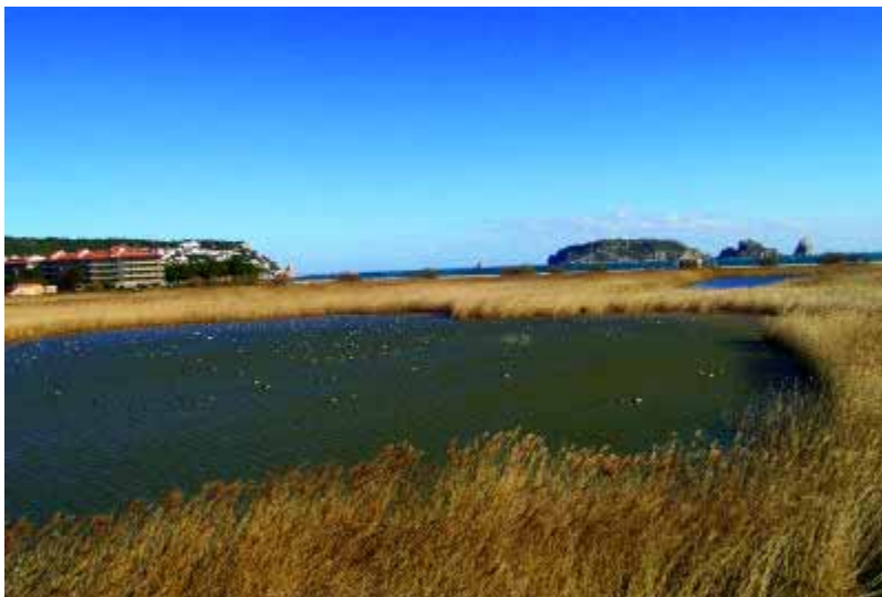
La conservació de Ter Vell com a espai natural, voltat però finalment no devorat per urbanitzacions, és ben representatiu de la necessitat d'una política activa i una gestió de proximitat per preservar els aiguamolls litorals.