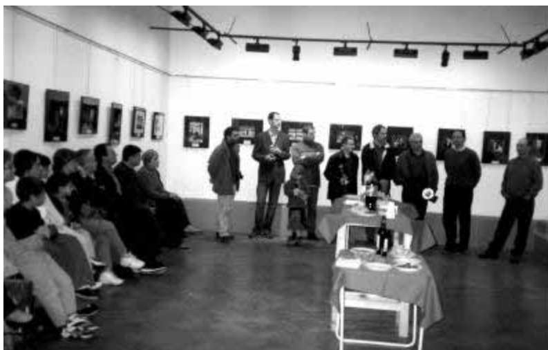
Liurament dels premis de l'últim concurs de fotografia convocat per Amics de la Fotografia.

Aquestes tertúlies també estan obertes a qualsevol persona que