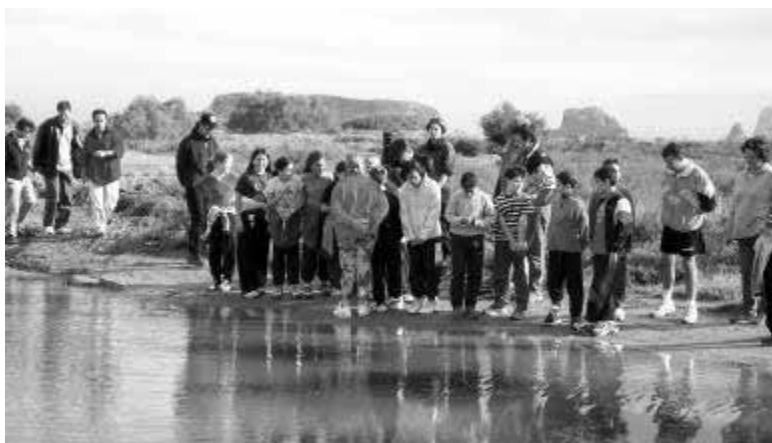
Alliberament de fartets a les noves llacunes.

llacunes s'han repoblat amb fartets capturats a Fra Ramon i criats en captivitat. La repoblació es va fer el passat mes de novembre i hem d'esperar a la primavera que ve per veure si la introducció ha tingut èxit. De moment ja han crescut poblacions de ruppia, una planta submergida on el fartet troba refugi. Si les poblacions de ruppia continuen creixent, és molt probable que la introducció de fartet tingui èxit a llarg termini.