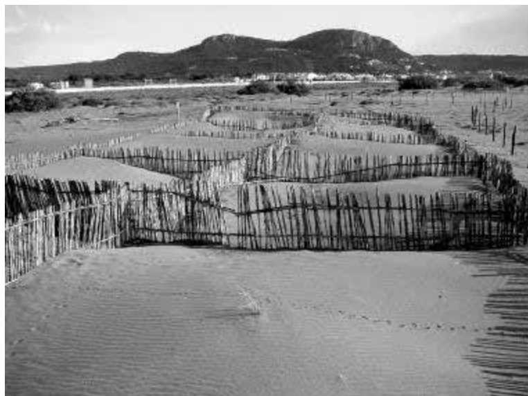
Tancats de canyes per recuperar la vegetació de dunes a la platja de la Pletera.