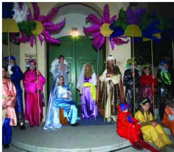
Els Reis de l'Estartit, com els de Torroella, també van ser notícia.