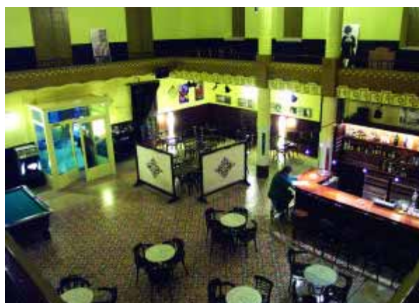
La Sala de Torroella de nou oberta de dijous a dilluns a partir de les cinc de la tarda.