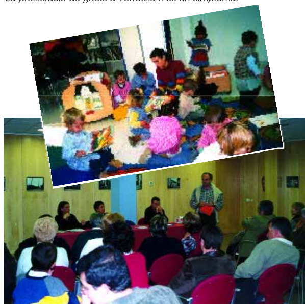
La creació del Consell Municipal de l'Estartit i la inauguració dels nous locals ha comportat un augment de les activitats socials i culturals a l'Estartit. A les fotos presentació del llibre Les filles de Sara i visita de l'Escola Bressol a la Biblioteca.