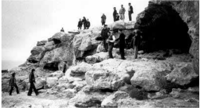
El 2002 es va anar a Formentera (a la foto, un moment de la visita) i es va presentar una exposició fotogràfica, dins els actes de germanor entre Torroella i Formentera.

Conscients de la demanda de moltes persones per adquirir coneixements, des de la seva fundació Amics de la Fotografia ha organitzat diferents cursets i, pel