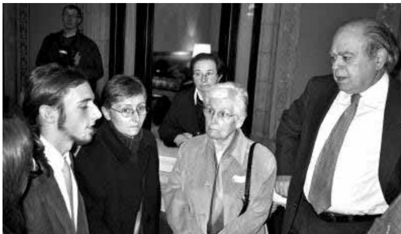
Al Parlament de Catalunya amb el president de la Generalitat

També vam fer una visita a un institut. A les aules vam explicar una mica d'on erem i què estàvem fent, vàrem estar al pati, al menjador escolar i després vam anar amb les famílies dels estudiants, que van compartir amb nosaltres la tarda i el sopar.