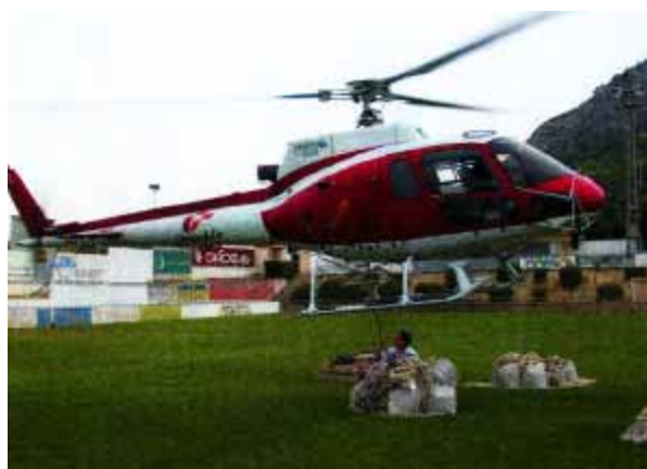
Es van fer obres de reparació al Castell i el material es va pujar amb aquest helicòpter.