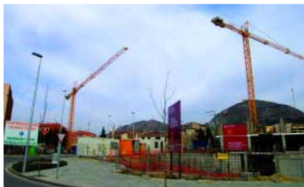
Un altre signe del creixement del municipi és l'augment de la construcció d'habitatges que majoritàriament seran de residència permanent, tant d'iniciativa privada com d'iniciativa pública. La proliferació de grues a Torroella n'és un símptoma.