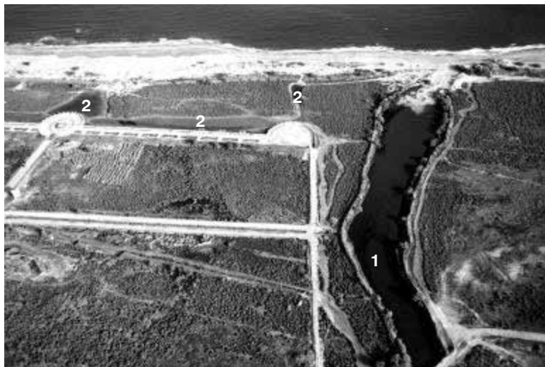
Fra Ramon (1) i les llacunes de nova creació (2) a la Pletera.

Per tal de diversificar els nuclis de població d'aquest peix que hi ha a la Pletera s'han construït tres noves llacunes , que es comuniquen quan els nivells d'aigua són alts, però que es mantenen aïllades al pic de l'estiu. Aquestes noves