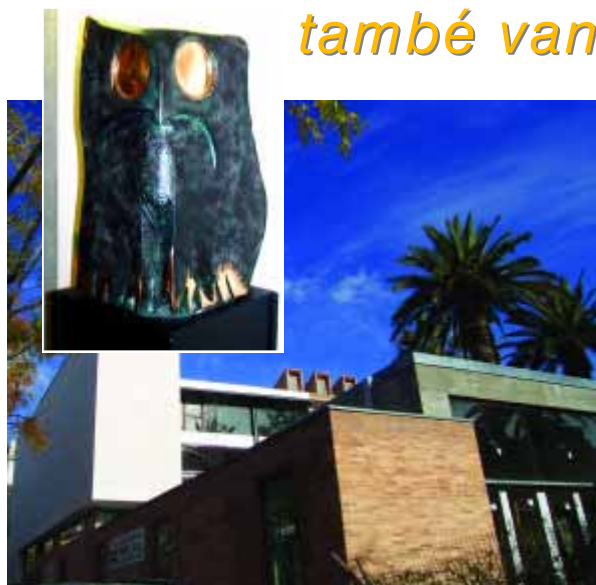
El Duc del Montgrí, obra de Pia Crozet que es col·locarà a Can Quintana i que establirà un diàleg amb altres mussols i xibeques que l'artista instal·larà a Ullà, Girona i St. Martí d'Empúries.