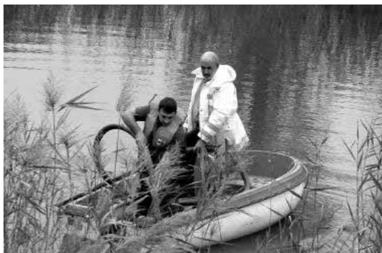
Treballs d'aspiració de fangs a Ter Vell.