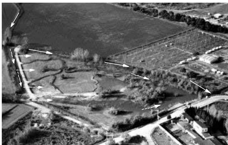
Vista aèria del sistema d'aiguamolls de depuració a la closa del mas d'en Bou. Les fletxes contínues indiquen l'antic flux d'aigua d'entrada. Les fletxes discontinües indiquen la nova circulació pels nous aiguamolls.

A Ter Vell s'han fet tres actuacions, dues d'elles, el dragatge de determinades parts de la llacuna i la neteja de fangs als punts més fons, tenen com a objectiu eliminar l'excés de matèria orgànica i nutrients acumulats al sediment de Ter Vell;