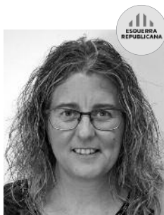
Anna Company Coll 5a tinenta d'alcalde Ensenyament Joventut