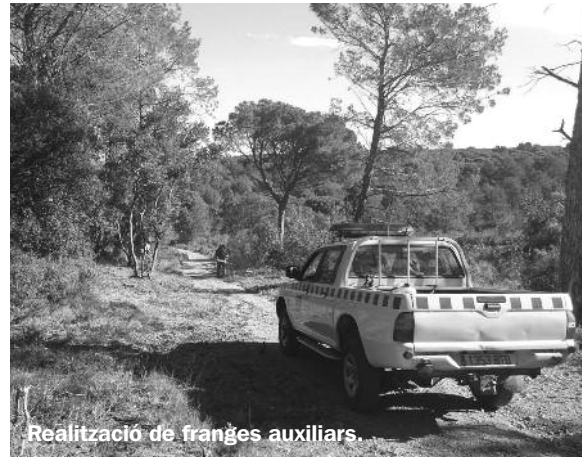
Realització de franges auxiliars.