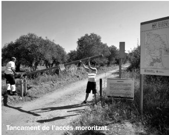
Tancament de l'accés motoritzat.