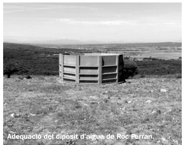
Adequació del dipòsit d'aigua de Roc Ferran.

El 17 de juny es va tancar l'accés motoritzat al Montgrí, prohibició que es mantindrà fins a mitjan setembre, durant el període de més alt risc. Amb aquesta mesura es vol reduir el risc d'inici d'un incendi forestal i garantir la seguretat dels béns i la protecció de les persones. S'han instal·lat 5 barreres mòbils i 4 fixes, més cartelleria informativa, als principals accessos. Malgrat les restriccions, l'Ajuntament expedeix autoritzacions a persones o veïns que han d'accedir-hi per motius de residència o feina.