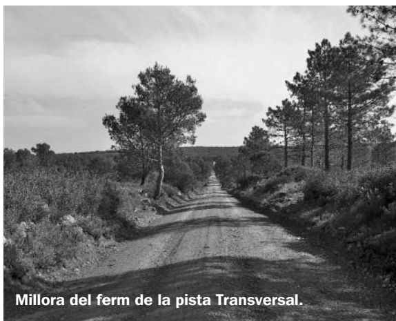
Millora del ferm de la pista Transversal.