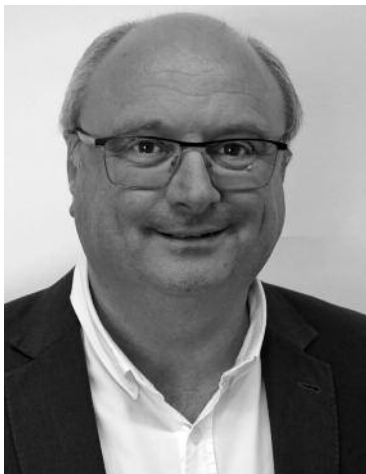
Jordi Colomé Massanas Alcalde