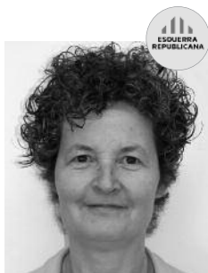
Natàlia Navarro Sastre Patrimoni Medi Ambient Arxiu Municipal