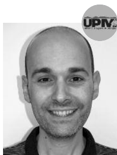
Genís Pigem Olivé Esports, Desenvolupament de la zona esportiva, Món Rural i Fires.