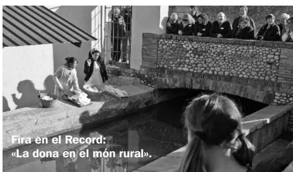
Fira en el Record: «La dona en el món rural».