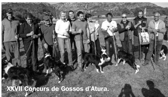
XXVII Concurs de Gossos d'Atura.

La Fira de Sant Andreu 2018, que es va celebrar l'1 i 2 de desembre, es va tancar amb l'assistència d'unes 35.000 persones. Aquest any el temps ens va acompanyar i això va ser clau. Excepcionalment per a aquesta època de l'any, vam gaudir de temperatures molt elevades, la qual cosa va fer que la presència de públic fos constant durant els dos dies.