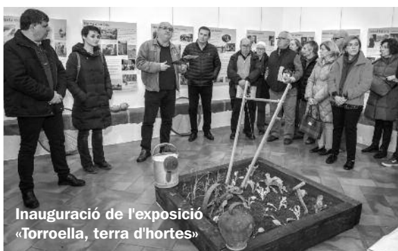
Inauguració de l'exposició «Torroella, terra d'hortes»