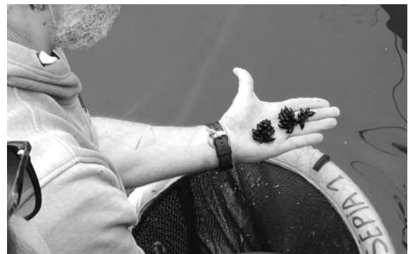
Un biòleg mostrant ous de sèpia recuperats.