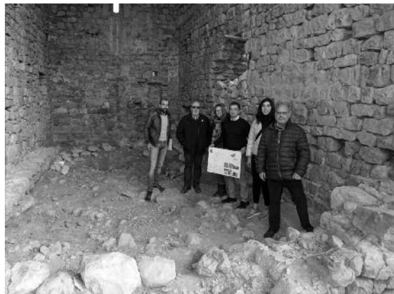
Imatges de la darrera visita d'obres realitzada el 31 de gener.

L'Ajuntament ha tancat la segona fase del projecte de consolidació de l'església romànica de Santa Maria de Palau (s. XIII) i ja ha planificat la tercera fase, que es desenvoluparà durant el 2019. Com en la primera fase, l'actuació està cofinançada per la Diputació (15.000 euros) i l'Ajuntament (10.000 euros).