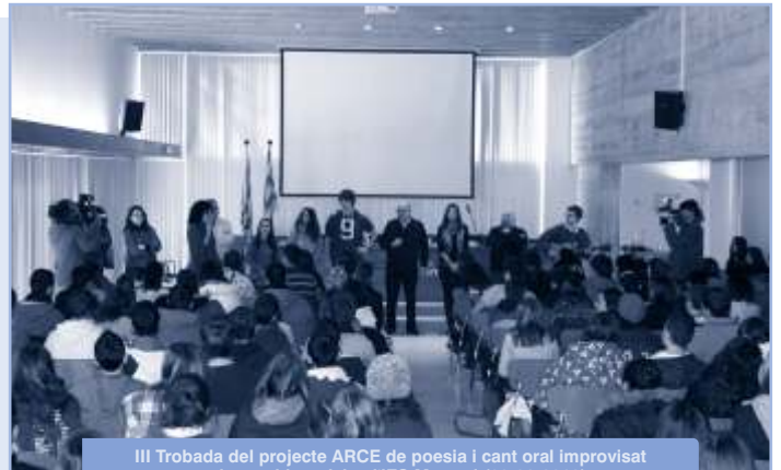
III Trobada del projecte ARCE de poesia i cant oral improvisat en la que hi participa l'IES Montgrí (09-02-2012)