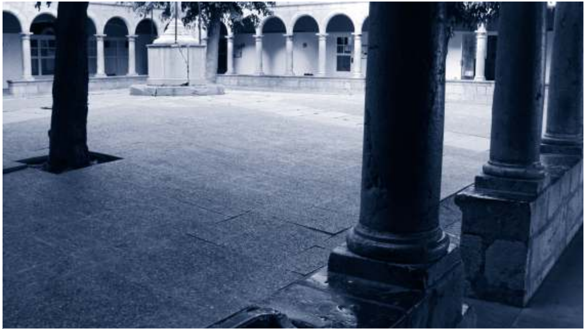
▲ La cisterna del Convent dels Agustins es troba sota el pati del claustre.

A la vila de Torroella, hi ha molts edificis que, a més a més del pou, al pati hi tenien una cisterna. D'entre els que avui són visitables hi ha can Quintana, el convent dels Agustins i la casa Galibern.