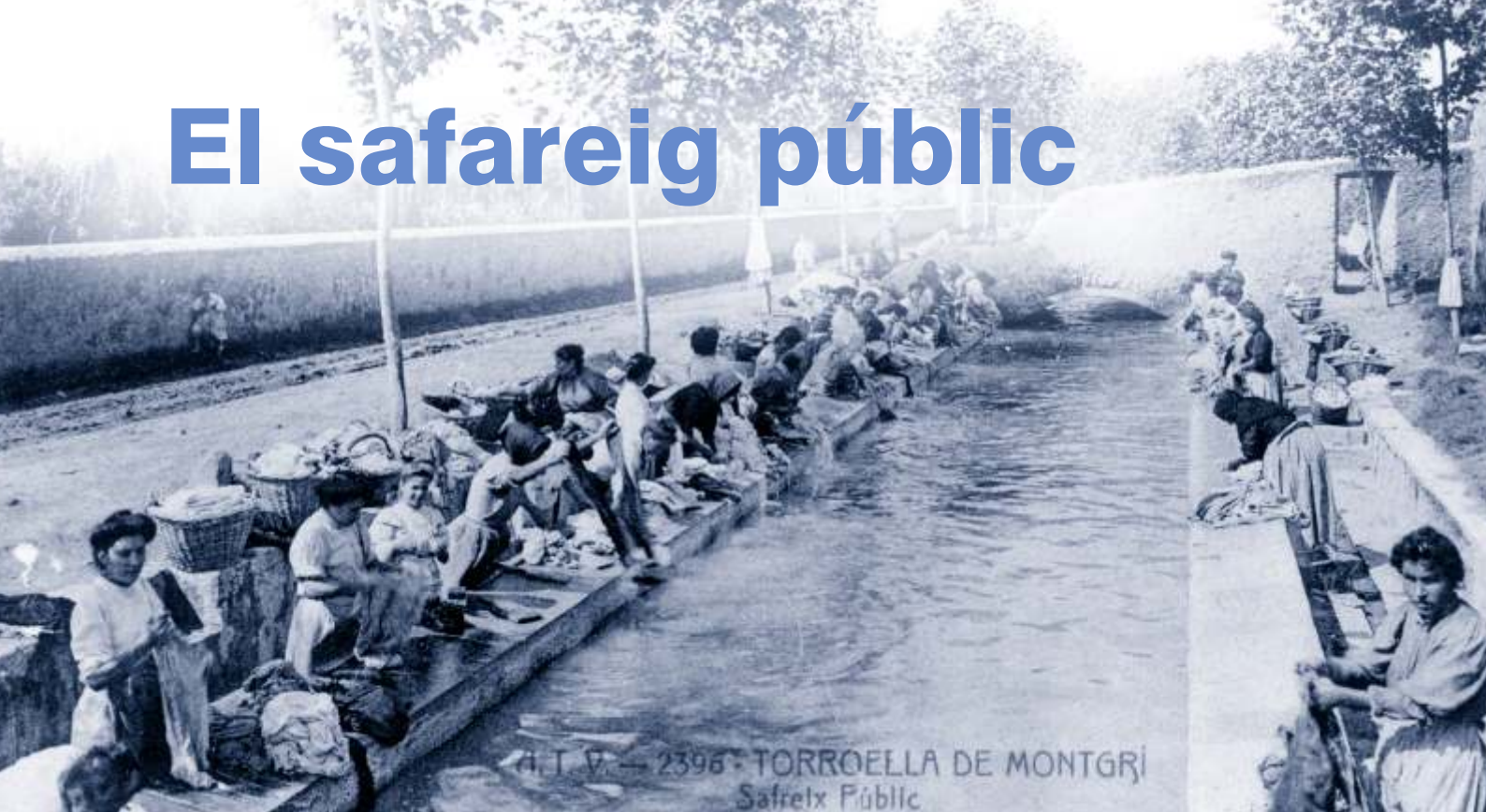
▲ El safareig públic era un espai fonamental de socialització femenina.