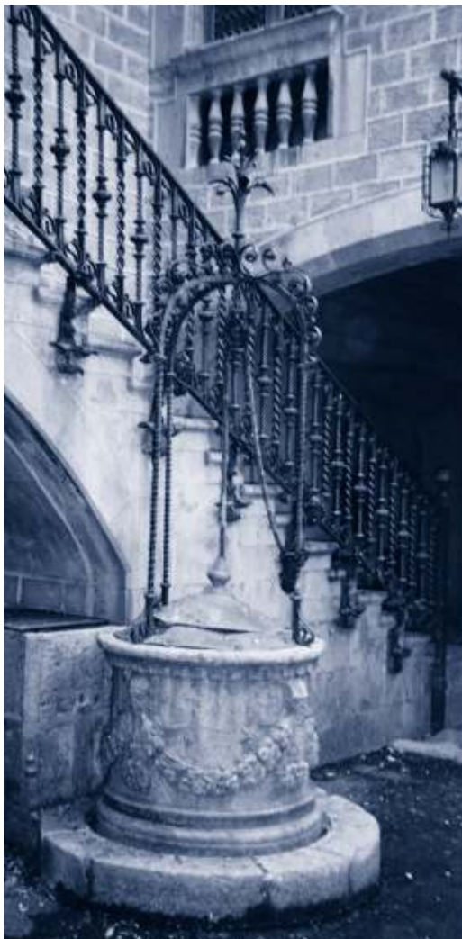
▲ A l'entrada del Palau Solterra, encara avui, es pot veure aquest pou.

Certament, aquests aprofitaments d'aigua subterrània en general eren pous oberts, amb un passamà de ferro de forma circular, per aguantar la corriola. De vegades s'empraren barres de ferro, llantes de roda de carrovelles. Habitualment, cada una de les cases disposava del seu corresponent safareig i la seva pica.