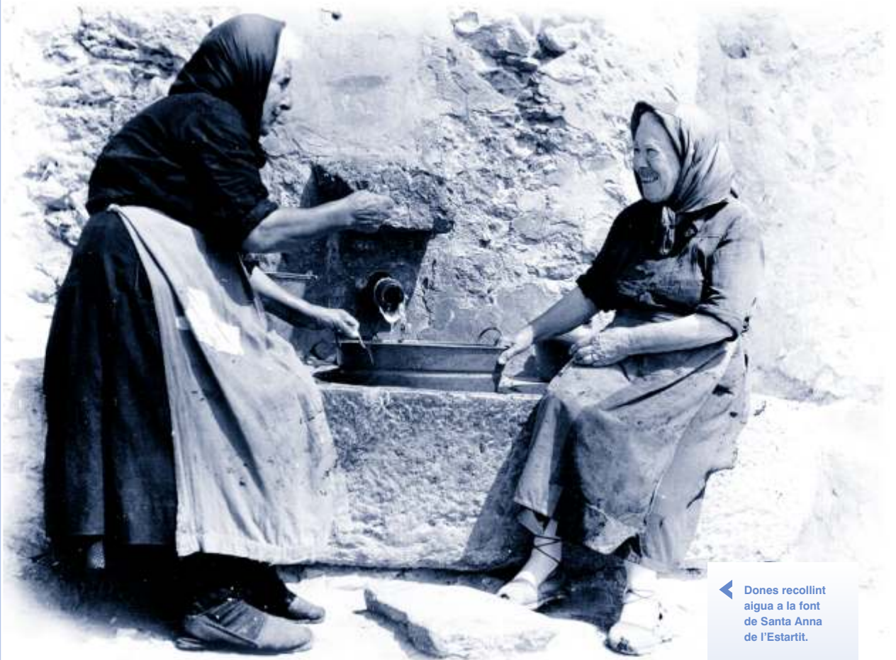
← Dones recollint aigua a la font de Santa Anna de l'Estartit.

L'aigua sempre ha esdevingut imprescindible per als assentaments i l'evolució de les societats. Al llarg de la història, l'home ha tingut la necessitat de proveir-se d'aigua per al seu ús domèstic i per regar els conreus. Ara, obrir una aixeta a qualsevol llar és un acte tan reflex que, sovint, oblidem les construccions relacionades amb els usos i l'abastiment d'aigua.