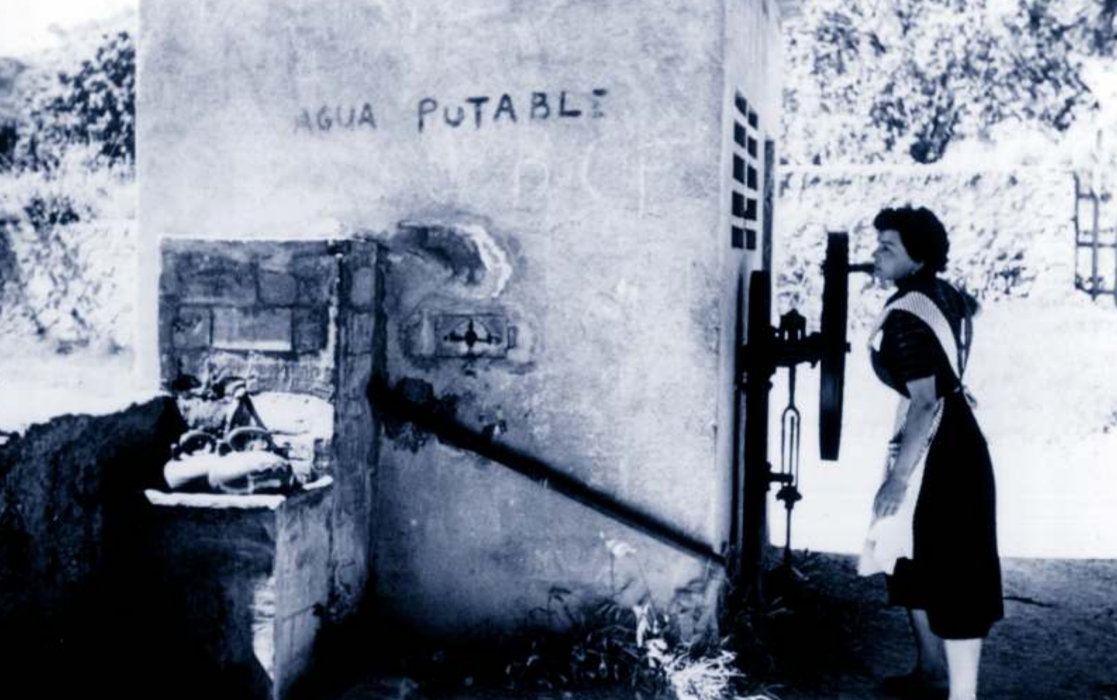
▲ Una dona extraient aigua del pou Nou, que es va construir a l'Estartit.

Les dones que vivien en cases pròximes al mar, segons Audvert, com que tenien la font de Santa Anna tan lluny, feien gairebé totes les feines de casa amb aigua de mar. I l'aigua potable anaven a buscar-la amb càntrics a la font, que els quedava a una mica més d'un quilòmetre.