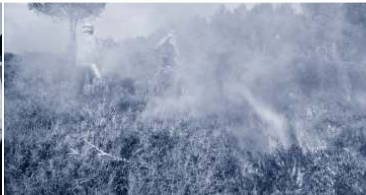
▼ Cremes controlades al massís del Montgrí.