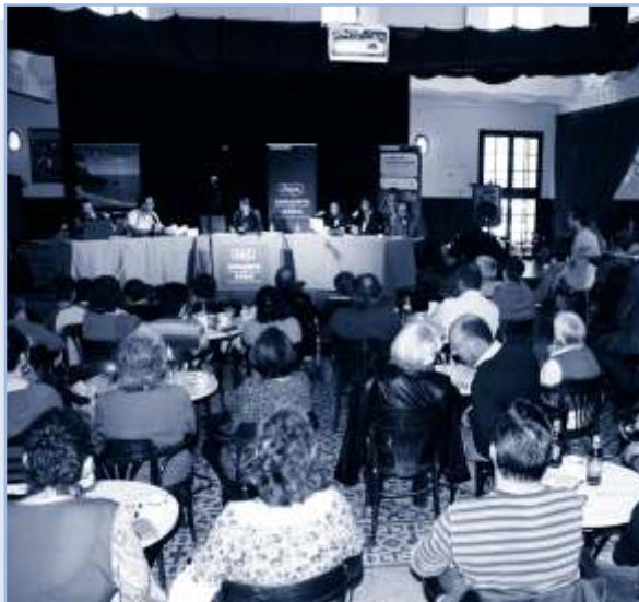
La Tribu de Catalunya Ràdio des de La Sala (04-05-2012)