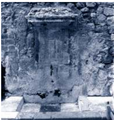
▲ La font dels Gossos és la més antiga de la vila.

Sembla que es coneix com la font dels Gossos, ja que al ser baixa els gossos hi podien mamar, cosa que no agradava gaire als usuaris.