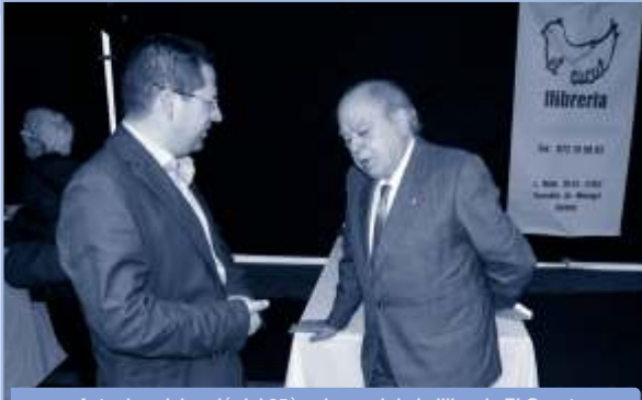
Acte de celebració del 25è aniversari de la llibreria El Cucut