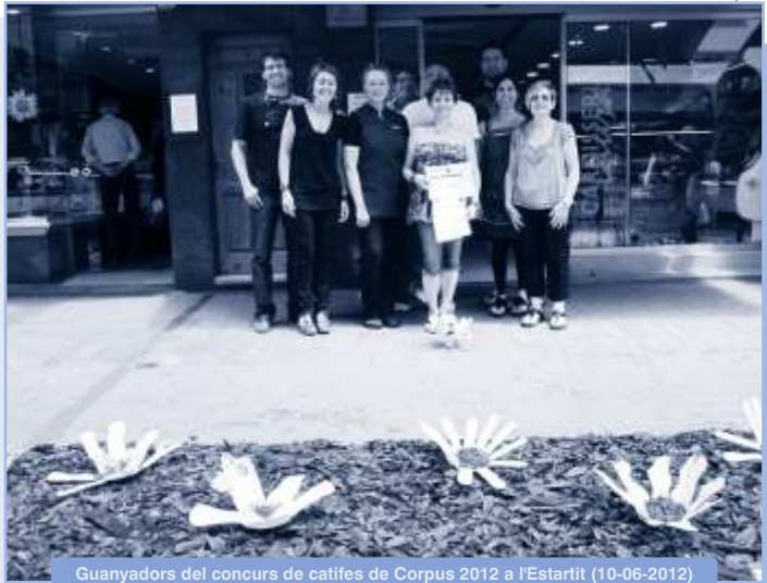
Guanyadors del concurs de catifes de Corpus 2012 a l'Estartit (10-06-2012)