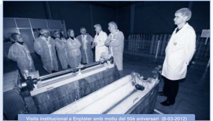
Visita institucional a Enplater amb motiu del 50è aniversari (8-03-2012)