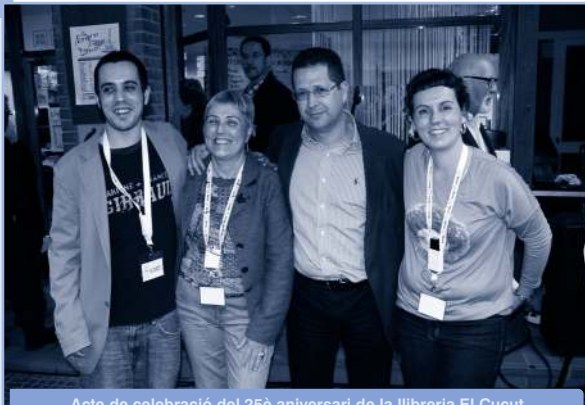
Acte de celebració del 25è aniversari de la llibreria El Cucut