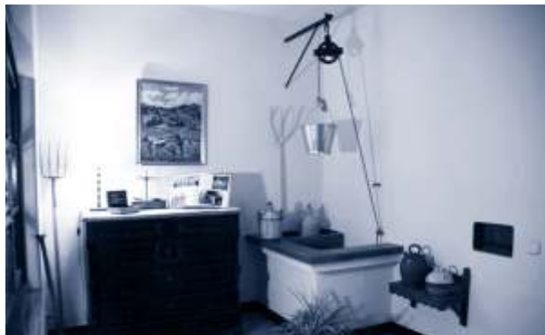
▲ Pou de l'entrada de can Ullastres.