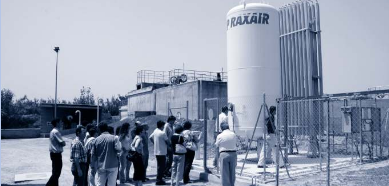
▲ L'any 2006 es va implantar un sistema innovador a la planta potabilitzadora per evitar les incrustacions de calç a la xarxa, que fins llavors només s'havia aplicat a la indústria.