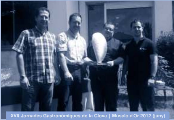
XVII Jornades Gastronòmiques de la Clova | Musclo d'Or 2012 (juny)