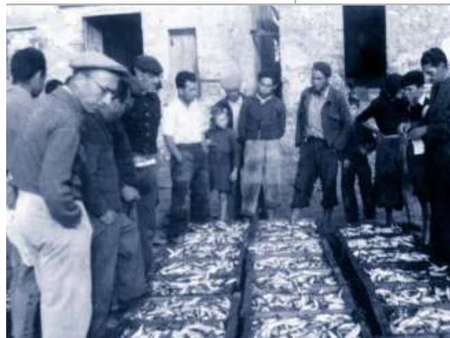
▲ Llotja de peix al passeig Marítim (anys 40).