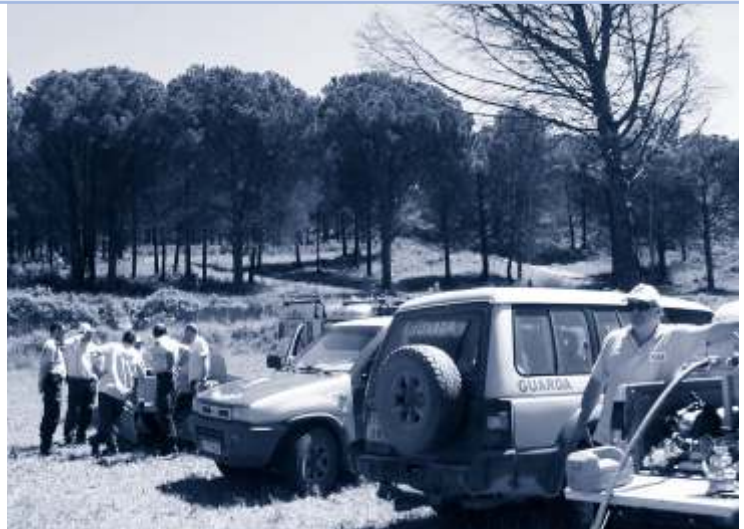
▲ Fent pràctiques a la muntanya.

Les agrupacions de defensa forestal (ADF) són associacions formades per propietaris forestals i ajuntaments dels municipis i tenen com a finalitat la conservació dels boscos i la prevenció i lluita contra els incendis forestals. La finalitat de l'ADF és elaborar i executar col·lectivament programes de vigilància i prevenció d'incendis, col·laborar en l'execució de mesures que, dictades per la direcció general del Medi Natural o altres organismes, tinguin competència en la lluita contra els incendis forestals, realitzar campanyes de divulgació sobre accions de prevenció, lluita contra incendis forestals i sensibilització de la població en el territori de l'ADF, així com també donar suport als bombers de la Generalitat de Catalunya en l'extinció d'incendis forestals.