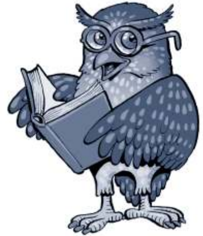
▲ La nova mascota de la biblioteca

També hem ampliat serveis i activitats: tenim wifi, hem introduït la música (Bibliomúsica) gràcies a l'Escola Municipal de Música, hem col·laborat en fires com la del Còmic, Terra de Pirates o la Fira de la Mediterrània, hem encetat un bloc i ens hem endinsat a les xarxes socials a través del Facebook.