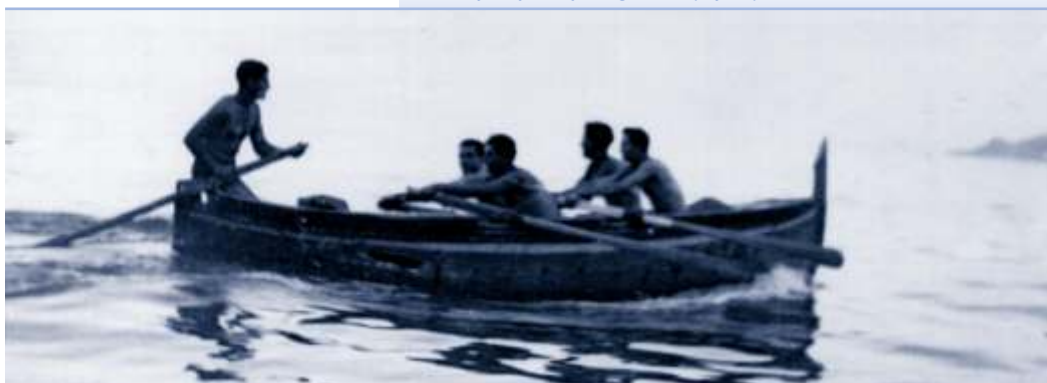
▲ Regata de la Mare de Déu del Carme (anys 30).