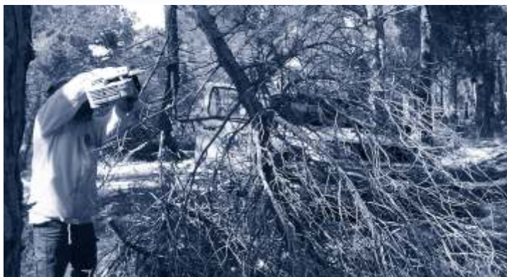
▼ Neteja de la carretera de les Dunes.