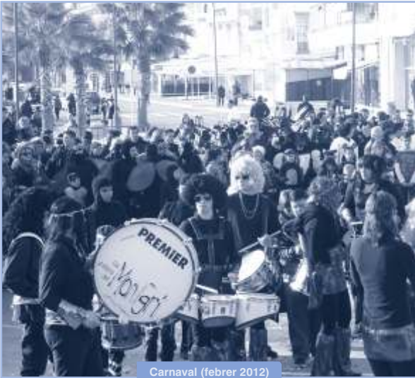
Carnaval (febrer 2012)