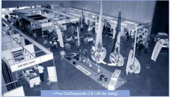
I Fira OciEmpordà (19 i 20 de maig)