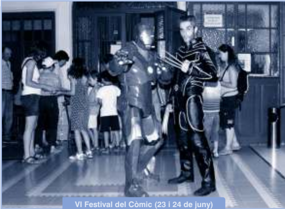
VI Festival del Còmic (23 i 24 de juny)