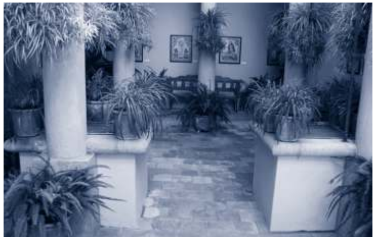
▲ Pati interior de la casa Galibern, amb el seu pou i cisterna.

La casa Galibern va ser aixecada l'any 1875 per Ramon Galibern. Es troba situada al senyorial carrer de l'Església, l'immoble és la seu de la Fundació Mascort. En el seu pati interior conserva un pou particular i una cisterna que recollia l'aigua de la pluja, un exemple més de l'aprofitament de l'aigua per a l'ús domèstic.