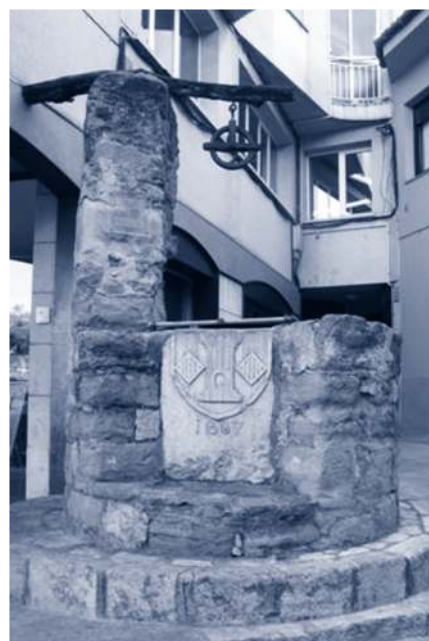
▲ Al carrer del Mar, el pou ha quedat situat a la vorera, enmig d'una estranya conjuntura d'edificis.