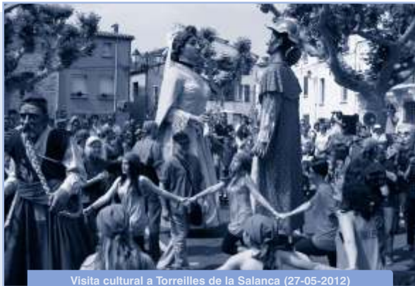
Visita cultural a Torrelles de la Salanca (27-05-2012)