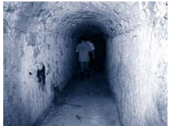
▲ Visita institucional amb mitjans de comunicació.