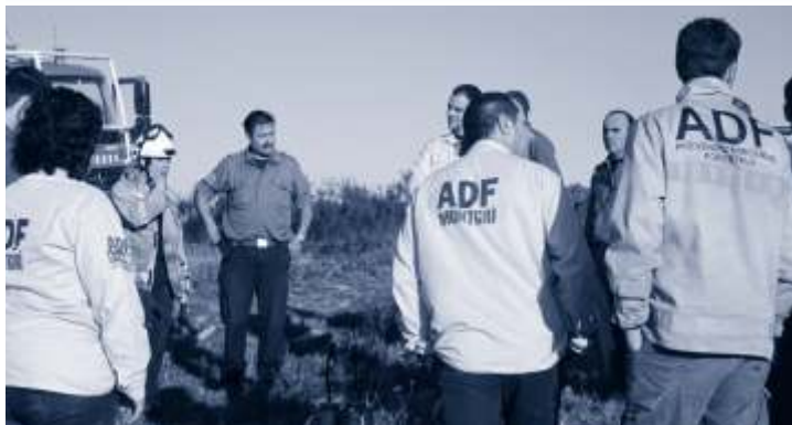
▼ Cremes controlades al massís del Montgrí, el 2011.