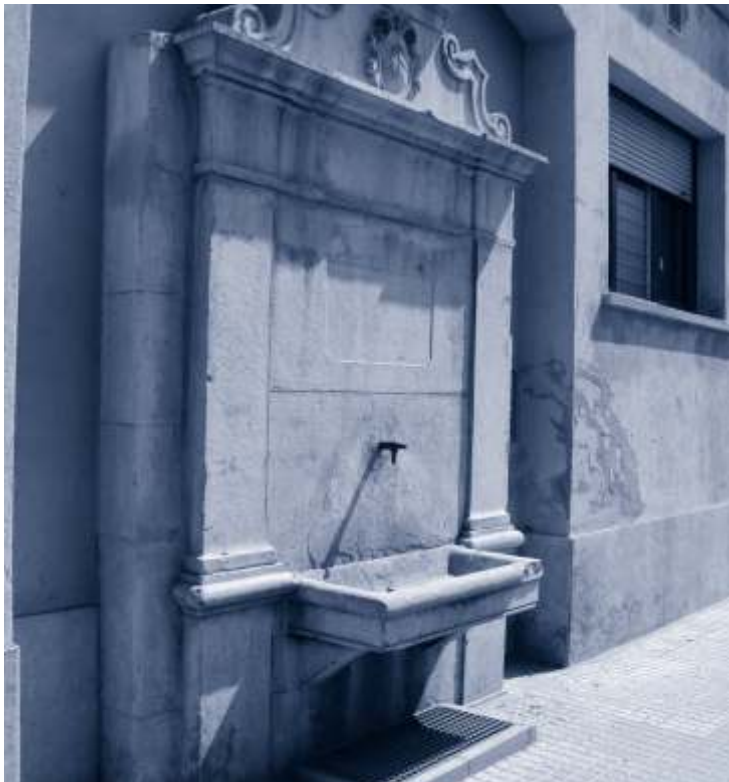
▲ El 1925, l'Ajuntament va fer posar la font de l'Hospital.