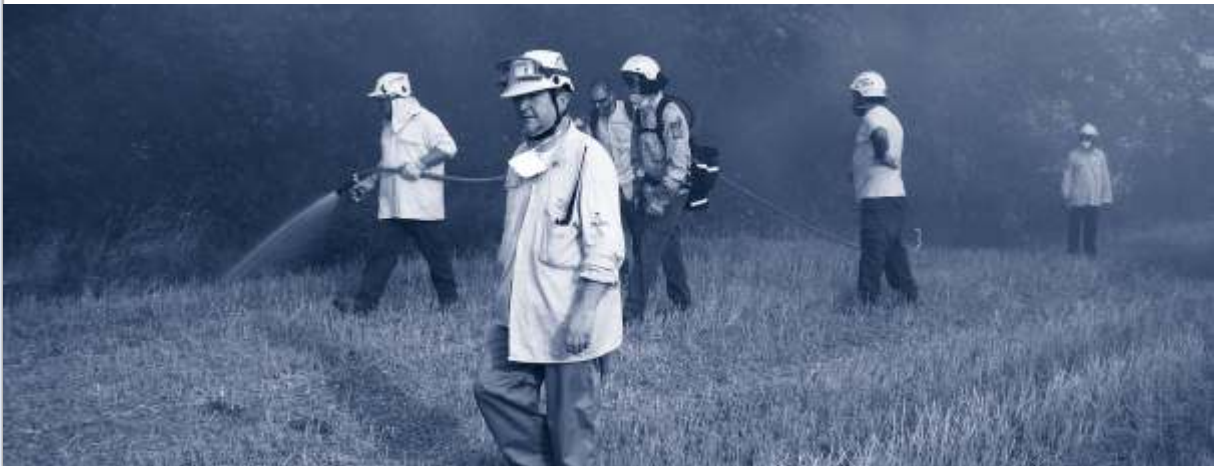
▲ Treballs d'extinció d'un foc a Vilopriu l'estiu del 2010.

L'ADF Montgrí va crear-se al febrer de 1999. L'Ajuntament de Torroella de Montgrí va ser-ne el promotor de la seva creació i va comptar també amb la implicació de l'Ajuntament d'Ullà i d'uns quants propietaris forestals del massís del Montgrí.