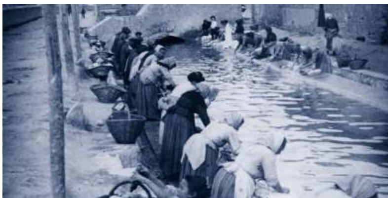
▲ La transformació de les rondes de la vila, va situar el safareig públic en aquest nou emplaçament.

El safareig que conservem actualment es va construir l'any 1926 en substitució de l'antic safareig situat a l'actual passeig de Vicenç Bou. El safareig, que rep l'aigua del rec del Molí, és un exemple clau per explicar-nos l'aprofitament i la canalització de l'aigua del riu Ter pel seu ús per al regadiu o per a altres usos públics com el de fer la bugada.