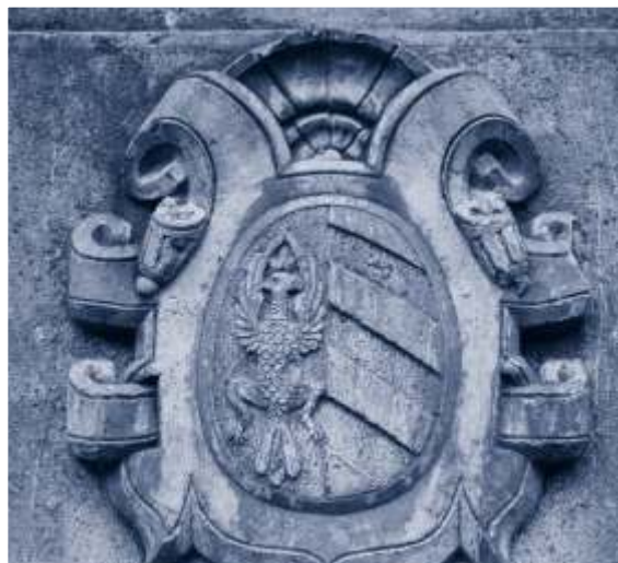
Font del passeig de l'església i detall de l'escut de la família Robert, amb el paó i les quatre barres de Catalunya.