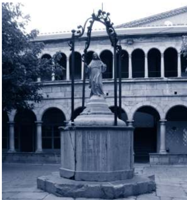
▲ Pou del claustre del Convent dels Agustins.

Aquestes construccions, com la majoria dels elements patrimonials destinats a usos socials que es conserven als pobles, daten de l'època moderna, sobretot a partir del segle XVII. Són senyal de modernitat, és a dir, denoten una evolució pel que fa als serveis públics i a l'abastament d'aigua d'una manera més generalitzada.