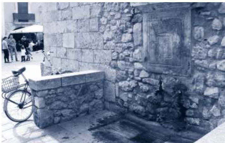
▲ En ser baixa, els gossos hi podien beure.