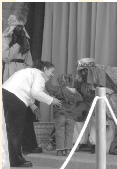
Portant la carta als Reis