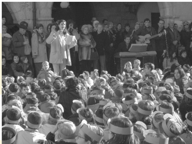
Cantada infantil de nades a la plaça de la Vila