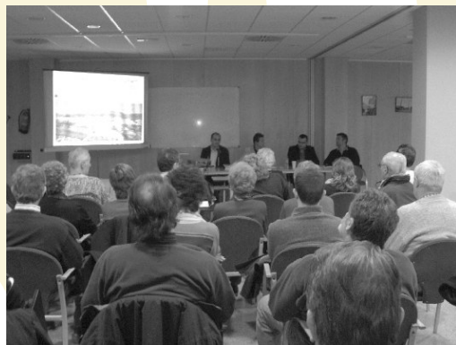
A dalt presentació del pressupost a Torroella A baix presentació a l'Estartit

de la biblioteca municipal. Un cop aprovat pel Ple, l'equip de govern va fer en dies posteriors la presentació pública del pressupost en diferents actes : a Can Quintana, al Centre de Serveis de l'Estartit, i als col·lectius de gent gran i estrangers. En tots aquesta actes el públic assistent va tenir l'oportunitat d'adreçar les seves preguntes i comentaris als representants municipals.